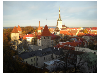
Tallinn, Capitale de l'Estonie

L'Estonie, pays balte dont la superficie est à peu près 1/12e de celle de la France, 1,3 millions d'habitants, c'est là-bas qu'une vingtaine de jeunes de 17 à 26 ans venant des églises luthériennes de Croatie, Norvège, Estonie et de la France se sont retrouvés pour